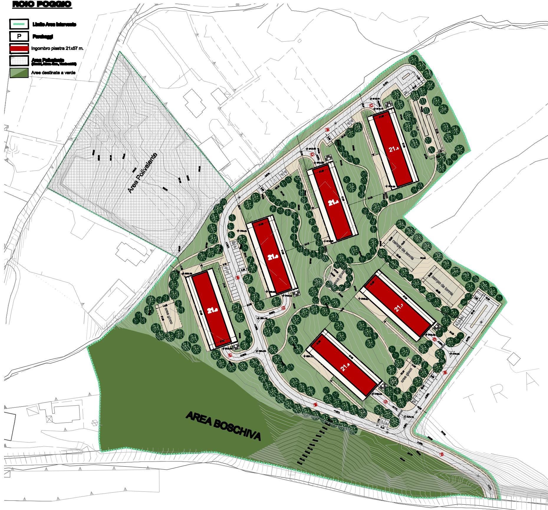
Planimetria generale scala 1:500